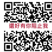
影片 QR code